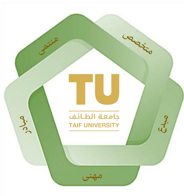
الشكل (١): خصائص خريجي جامعة الطائف-٢ (TUGA-2)